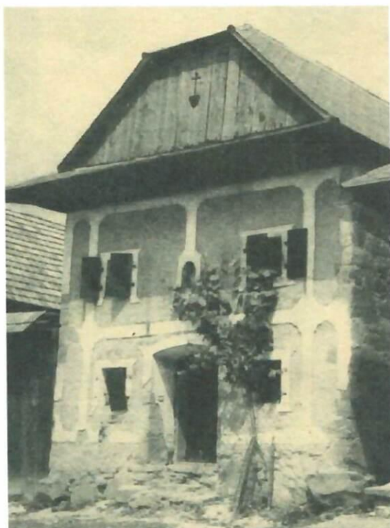
Obrázok č. 4: Kamenná sypáreň (pri dome č. 78)