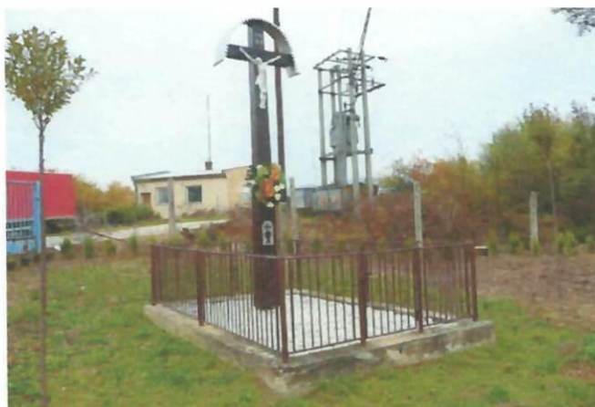
Obrázok č. 5: Obnovený drevený kríž (pri býv. družstve)