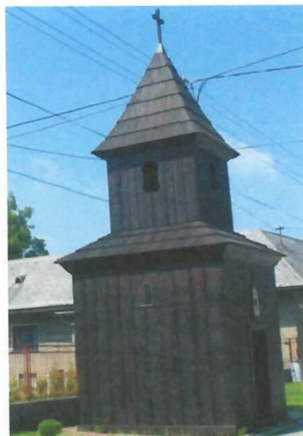
Obrázok č. 3: Drevená zvonica z prvej polovice 19. storočia

Drevená zvonica so štvorcovým pôdorysom a v stavanou vežou, šalovaná, debnená, s nadstavcom, vysadenou izbicou a ihlanovou strechou bola postavená v polovici 19. storočia. Vo výklenku bola v minulosti ľudová socha, kópia Piety z Tužiny z 1. polovice 19. storočia. Vo veži je zvon z roku 1783, ktorý je od roku 2010 v zozname národných kultúrnych pamiatok. V obci je niekoľko kamenných sypární a drevených krížov z 20. storočia.